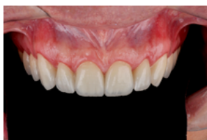
FIG. 1 - Aspecto extra oral inicial