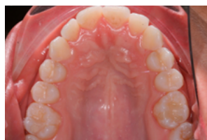
FIG. 2 - Vista da Superfície oclusa