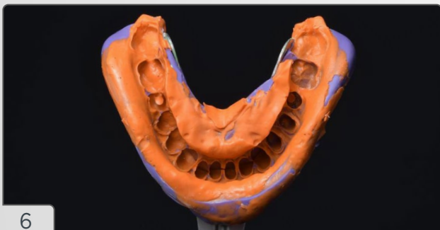
6 | Moldagem realizada com Silic-One.