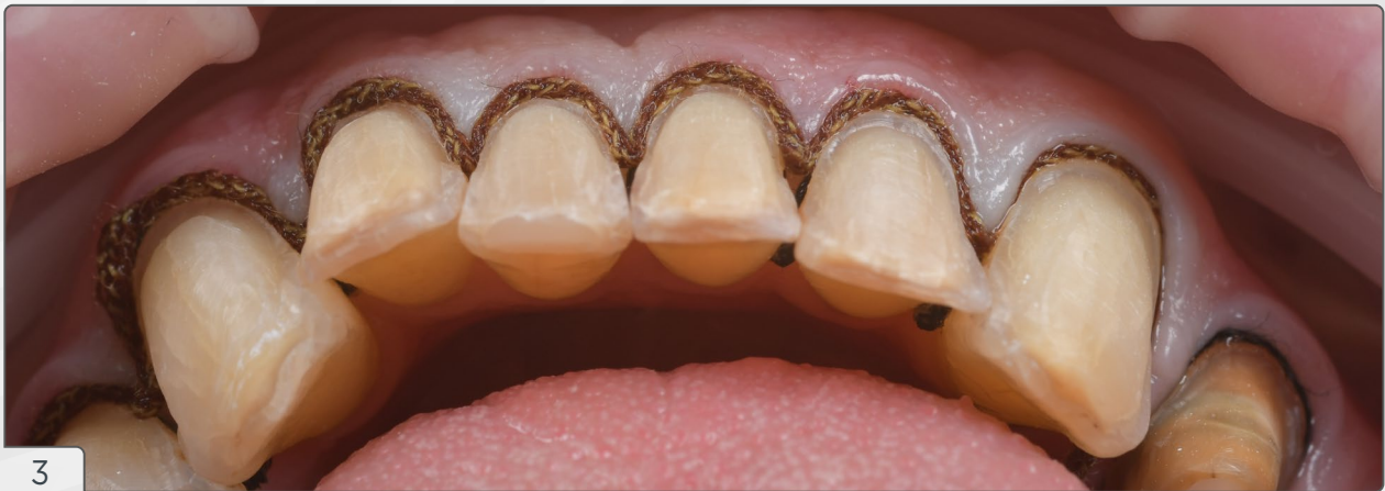
3 | Vista oclusal evidenciando o segundo fio retrator (Fio 00) inserido no sulco gengival.