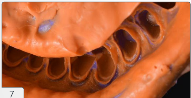
7 | Detalhe da moldagem, evidenciando a penetração do material no espaço criado pelo afastamento gengival obtido com o fio retrator.