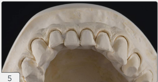
5 | Modelo mestre (gesso) mostrando a cópia das margens dos preparos possibilitada pelo afastamento gengival.