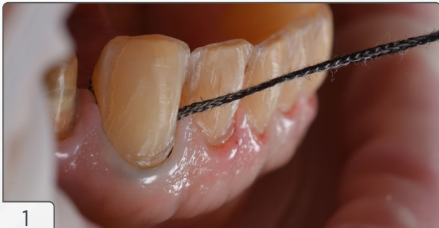
1 | Início da inserção do Fio 000.