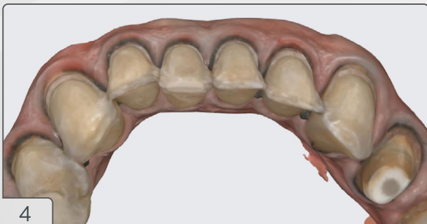
4 | Escaneamento dos preparos.