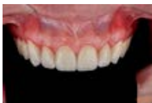
FIG. 1 - Aspecto extra oral inicial