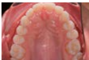
FIG. 2 - Vista da Superfície oclusa

REFERÊNCIAS BIBLIOGRÁFICAS - (Norma Vancouver)